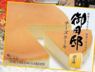
試食とショッピング