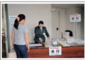
全ての準備が整い、お客様をお出迎え。当日ふいにお越しになる方があり席が足りるかが心配でした。