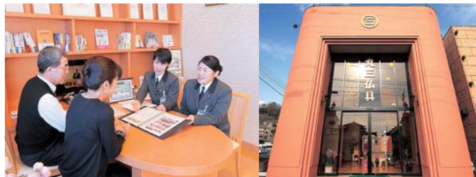
丸三仏具 葬儀事前相談センター