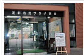
ご案内の看板も設置完了!!