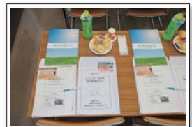
本日の資料とお菓子、飲み物も準備完了!