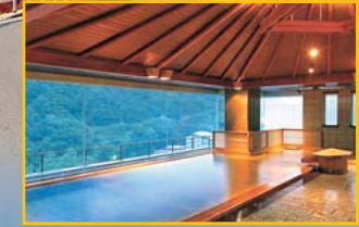
湯量豊富な天然温泉 / 美人の湯に癒しの力