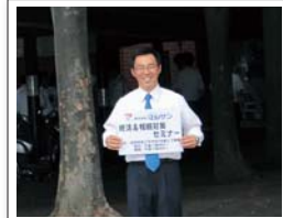
良い笑顔!と緊張の顔?でご来場を待つマルサンスタッフです。