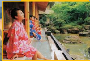
圧倒的湯量を誇る天然温泉