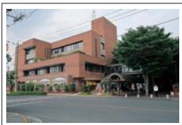
会場は「足利市民プラザ」です。ご協力ありがとうございました。