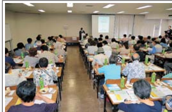
スタッフ一同心配していた席数もなんとかがりぎりセーフの会場です。