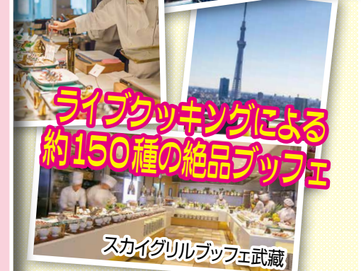
ライブクッキングによる 約150種の絶品ブッフェ