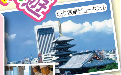
浅草ビューホテル