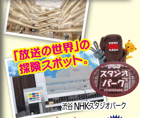
「放送の世界」の 探検スポット。