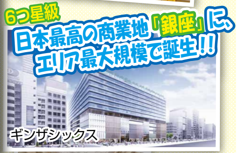
6つ星級 日本最高の商業地「銀座」に エリア最大規模で誕生!!