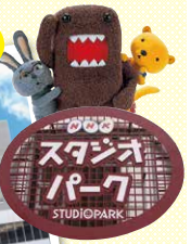
渋谷 NHKスタジオパーク